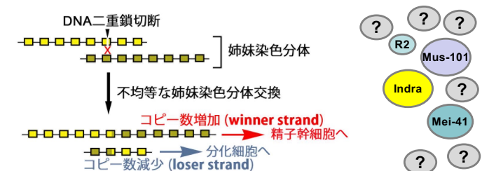
図2 精子幹細胞におけるrDNAコピー数回復のメカニズムと関与因子

ショウジョウバエの雄性生殖細胞では、加齢に伴いrDNAコピー数が減少する。その一方で、精子幹細胞にはrDNAコピー数を回復するメカニズムが存在している。そのため、生殖細胞の系列は、世代を超えてrDNAコピー数を維持することができる。rDNAコピー数維持機構によって、生殖系列は加齢を免れ「不死性」を獲得していると考えられる。